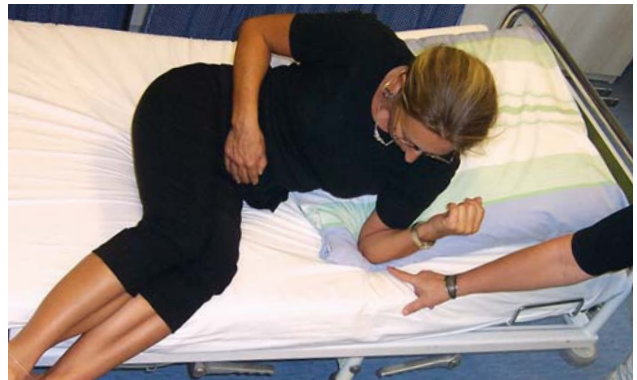
In der Bewegungskontrolle spielt der Ellenbogen eine tragende Rolle.